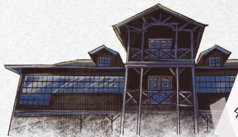
CASONA DE CAMPO

Te invitamos a nombrar tres especies que son propias de la zona del Llanquihue y que viste durante tu recorrido por el parque.