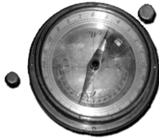
( Brújula. 1820)