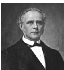
Retrato n° 2